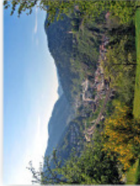
Wandern bei Hornberg