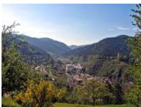
Wandern bei Hornberg